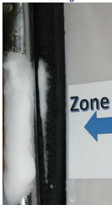
Application mousse Laisser agir