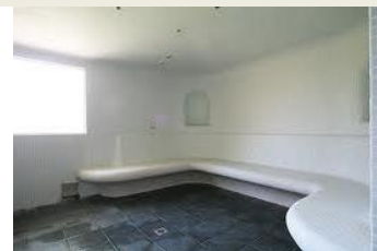
Hammam – sauna