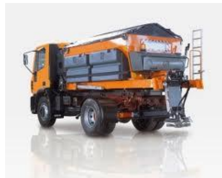
Protection de matériel en période de non utilisation