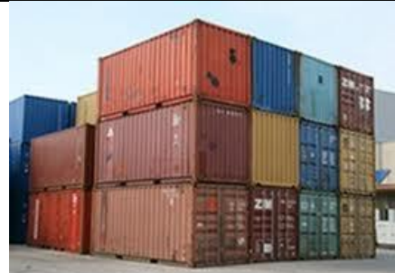
Protection de matériel en transit maritime